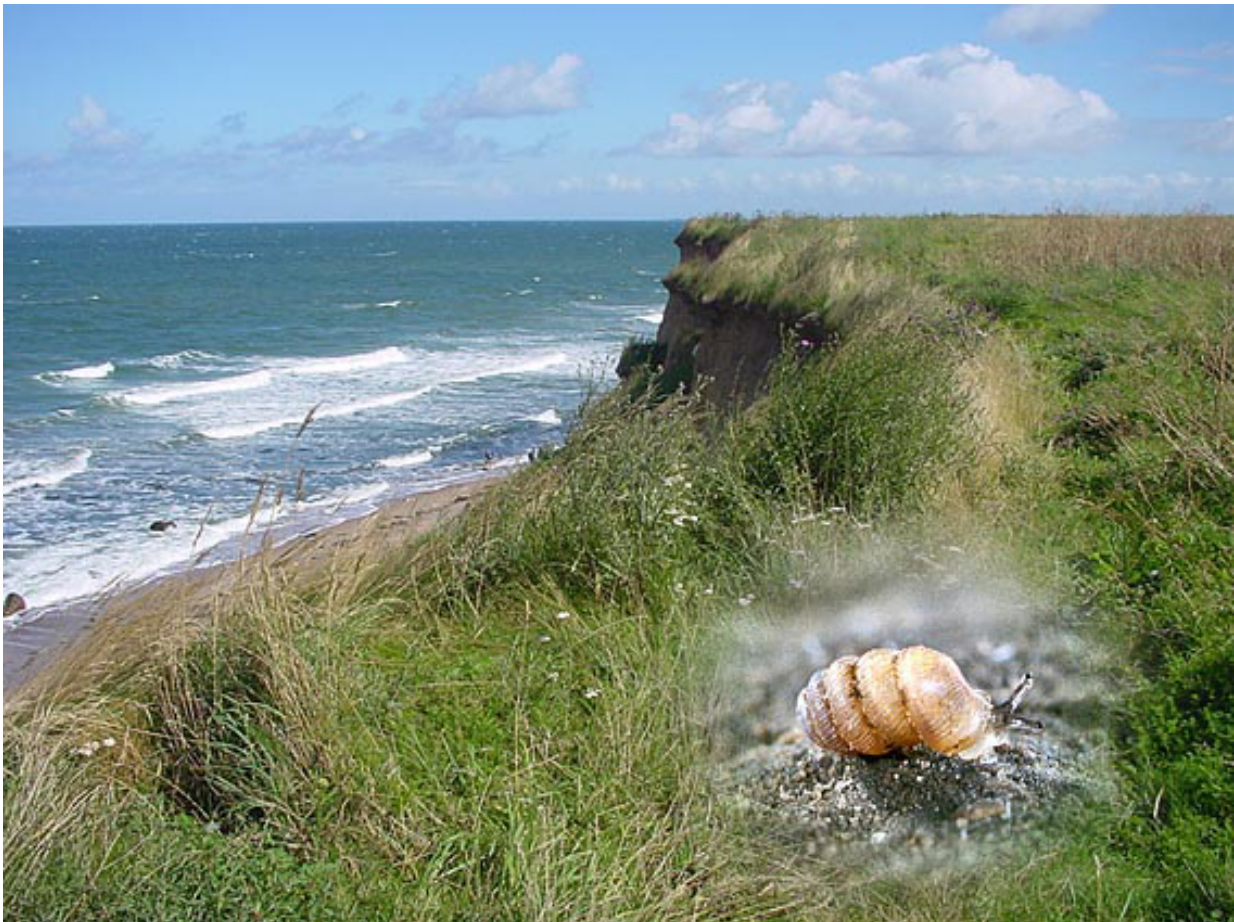
Abb. 4: Die Wulstige Zylinderwindelschnecke ( Truncatellina costulata ) und ihr natürlicher Standort (Fotos und Fotomontage V. Wiese).

Es wurden insgesamt 48 Landschneckenarten nachgewiesen (BÖP 2003). Darunter einige extrem seltene Arten mit Bindung an Kalkhalbtrockenrasen und warme Säume, wie z. B. die Wulstige Zylinderwindelschnecke ( Truncatellina costulata [Nilsson] 1823, Abb. 4). Neben den Trockenlebensräumen weisen das Salzgrünland und die Röhrichte in der Eichholzniederung eine Reihe bemerkenswerte Schneckenvorkommen auf, wie z. B. Populationen der Sumpfwiesen-Puppenschnecke ( Pupilla [muscorum] pratensis ) und der Zweizähniigen Puppenschnecke ( Pupilla cf. bigranata ). Für die genannten Arten der Gattung Pupilla ist die Artabgrenzung derzeit noch nicht geklärt (V. Wiese, mdl. Mitt.). Zusammen mit weiteren Schneckenarten sind nach BÖP (2003), „die im Bereich des Projektgebiets bei Johannistal festgestellten Molluskenvorkommen für Schleswig-Holstein [...] als nahezu einzigartig zu bezeichnen“.