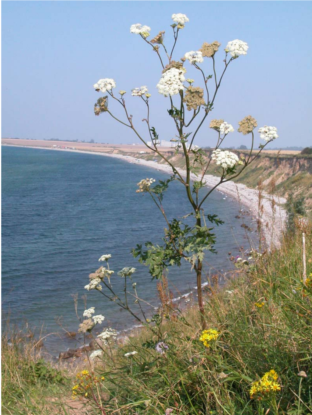
Abb. 3: Die in Schleswig-Holstein vom Aussterben bedrohte Heilwurz ( Seseli libanotis ) ist eine bezeichnende Art der thermophilen Staudenfluren des Gebietes, hier im Steilhang West (Foto H. Drews August 2002).