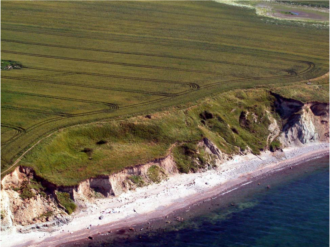
Abb. 2: Das „Hohe Ufer“ (Foto H. Drews Juli 2002).

Der geologische Aufbau mit stauenden, z. T. tonigen Schichten im Steilküstenfußbereich verursacht die besondere Abbruchdynamik am Hohen Ufer und im Steilhang West. Niederschlagswasser, das im angrenzenden Hinterland zur Steilküste versickert, tritt am Steilküstenfuß aus. Durch das Wasser werden die lehmigen Schichten aufgeweicht und können dann ein Gleitlager für den darüber stehenden Steilhang bilden. Dadurch werden gelegentliche terrassenartige Abrutschungen ausgelöst, die dann über Jahrzehnte stabil sind. Die Terrassen des Hohen Ufers sind beispielsweise bereits in Karten von 1936 dargestellt. Solche Vorgänge sind z. B. auch aus anderen Steilküsten der Ostsee bekannt und dort untersucht worden, teils auch erst in jüngerer Zeit aufgetreten, wie z. B. in den 1980er Jahren am Voderup Klint an der Südküste von Ærø, Dänemark.